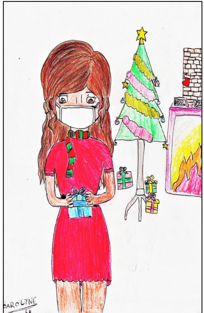
Illustration: Carolyne 5B

-Ils n'ont jamais été occupés pour Noël ! Je suis sûre que tu ne les as même pas appelés pour savoir s'ils voulaient venir malgré l'épidémie !