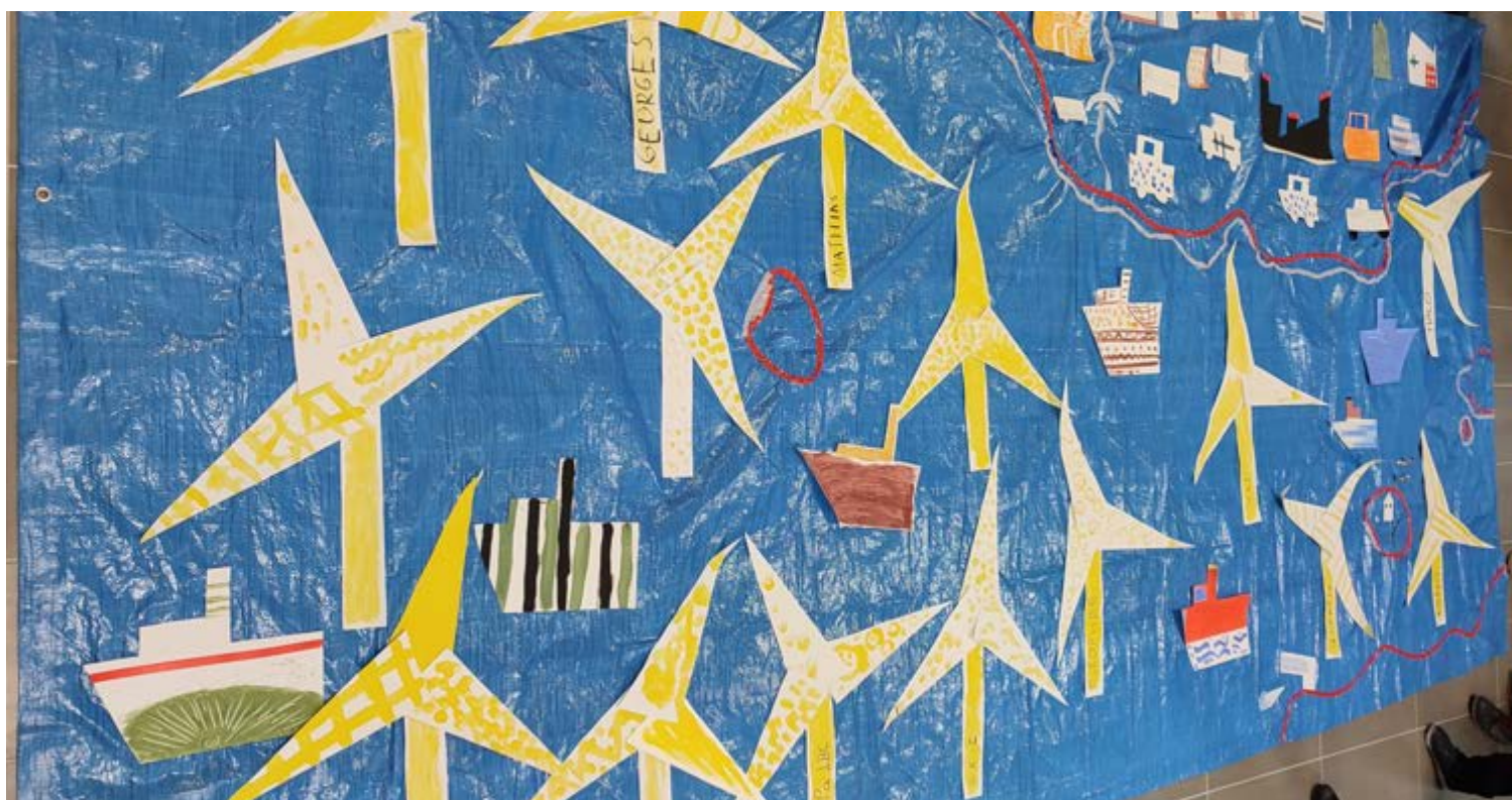
Photo de la fresque exposée dans le réfectoire du self